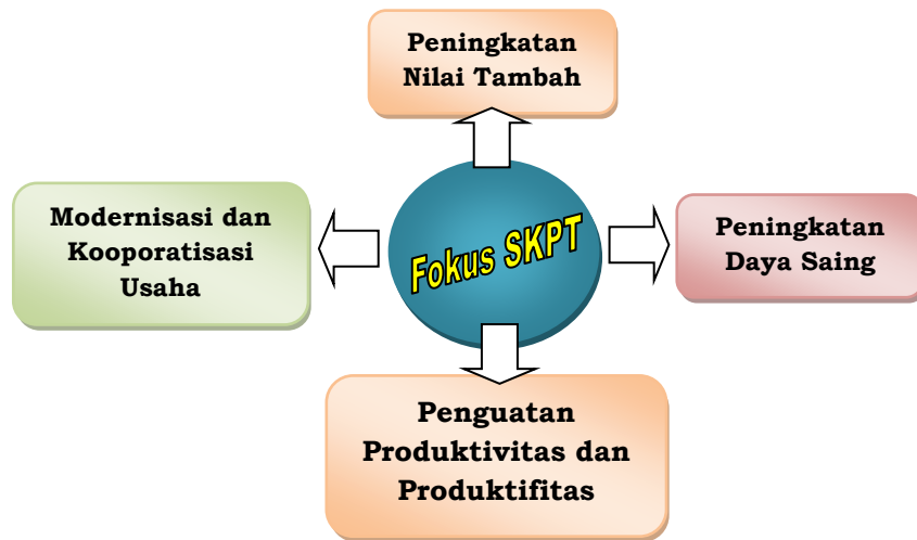
Gambar 2. Fokus Pengembangan Sentra Bisnis Kelautan dan Perikanan

produksi dan produktivitas pelaku utama dan pelaku usaha kelautan dan perikanan.