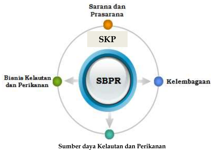
Gambar 1. Komponen pokok Sentra Kelautan dan Perikanan (SKP)

Secara konseptual, SKPT terdiri dari 4 (empat) komponen pokok, yaitu; (1) pembangunan dan pengembangan sarana dan prasarana; (2) pengembangan kelembagaan; (3) pengembangan bisnis kelautan dan perikanan; dan (4) pengelolaan sumber daya kelautan dan perikanan berkelanjutan.